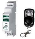
Radio kontrol sistemleri