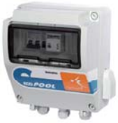
Düşük seviye kontrolü